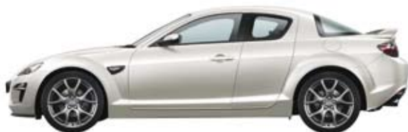
Crystal Weiß MC (34K)