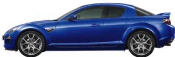
Aurora Blau MC (34J)