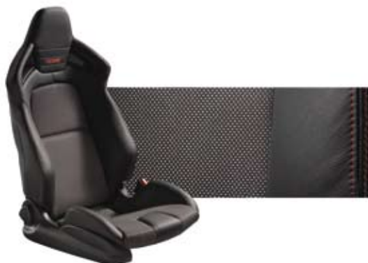
RECARO-Sitze, Innenfarbe schwarz, rote Ziernähte, Farbcode FG7

Bei einigen unserer modernen Metallic-Lackierung werden bewusst unterschiedliche Farb-Pigmente verwendet. Dadurch werden unter bestimmten Lichtverhältnissen, z.B. direktem Sonnenlicht, attraktive Farbeffekte erzielt. Zum Teil kann die Farbe changieren, z.B. von schwarz zu dunkelblau. Die hier abgebildeten Farbmuster geben aus drucktechnischen Gründen Farben ohne Farbeffekte wieder.