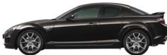
Sparkling Schwarz MC (35N)