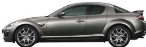
Aluminium M (38P)