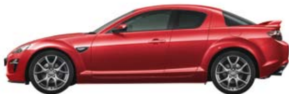
Velocity Rot MC (27A)